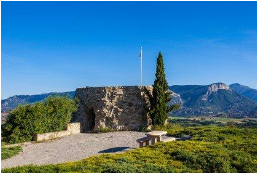
Upaix : La Tour aménagée en table d'orientation